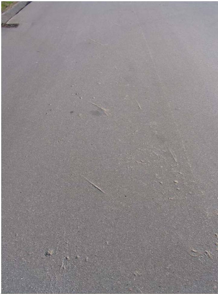
Vulster i asfaltmaterialet.