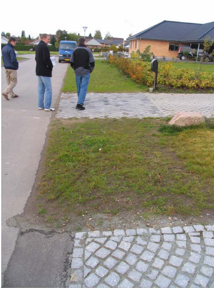
Sidearealer og tilslutninger.