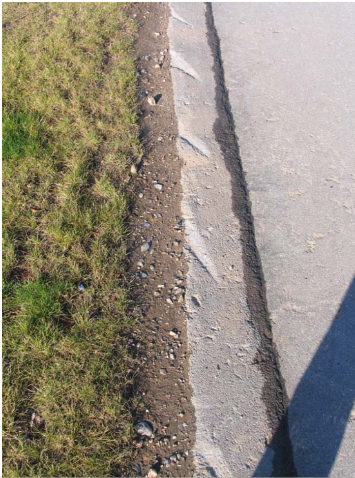
Asfaltskader pga. mekanisk påvirkning.