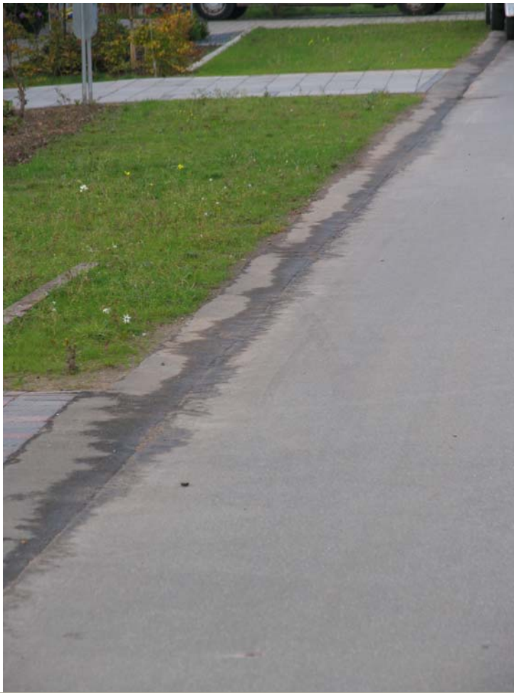
Asfaltkanter - skal disse erstatte en kantsten ?